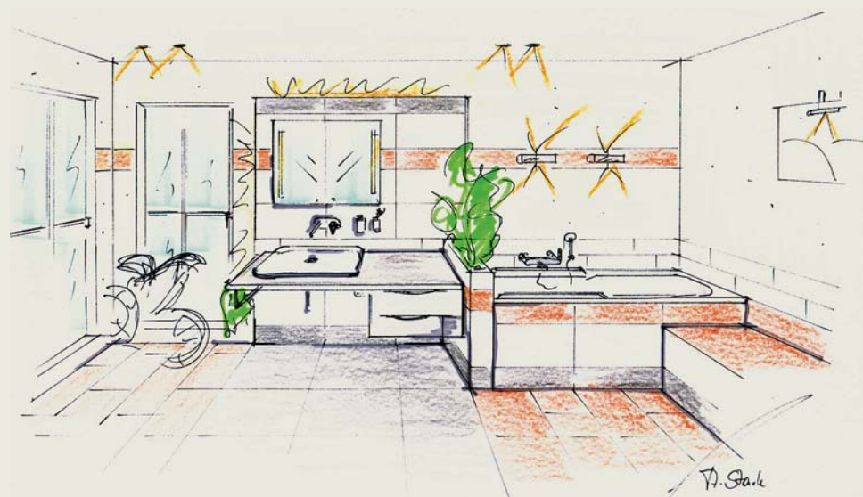
Der Waschtisch ist unterfahrbar und die Badewanne mit zusätzlichen Griffsystemen ausgestattet.

che, die sich jederzeit unproblematisch verändern lassen. Die rostfarbene Bordüre wird im Format 15 x 60 Zentimeter in Augenhöhe komplett an den Wänden herumgeführt und verbindet so den Raum zu einer Einheit. Eine optimale Wirkung wird erzielt, wenn die streichfähigen Flächen fliesenbündig – zum Beispiel mit Rigips - angearbeitet werden.